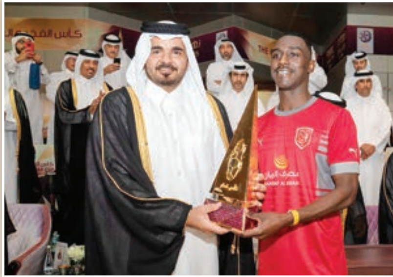
كأس قطر ضمن لقب الفريق هذا الموسم

تحقيق لقب «الدوري» لم يكن سهلاً.. والعربي يستحق الإشادة