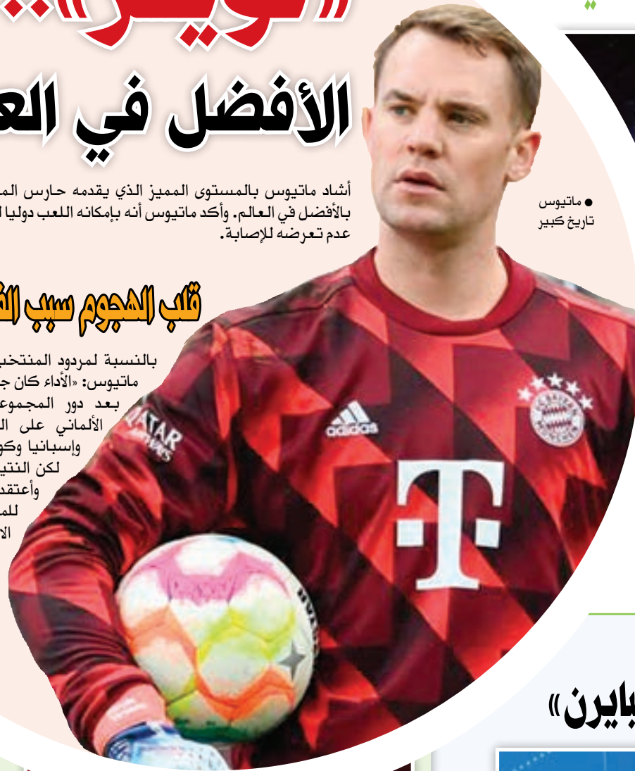
● ماتْيوس تاريخ كبير

بالنسبة لمرمى المنتخب الألماني في موندِيال قطر قال ماتْيوس: «الأداء كان جيدا لكنني تفاجأت طبعاً بالخروج بعد دور المجموعات، حيث سيطر المنتخب الألماني على المباريات الثلاث أمام اليابان وإسبانيا وكوستاريكا، وكان الأداء جيدا، لكن النتيجة كانت سيئة ومؤسفة، وأعتقد أن الفرص كانت ممتازة للمنتخب الألماني من خلال الاستحواذ على الكرة».