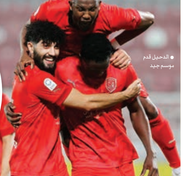
• الدحيل موسم جيد