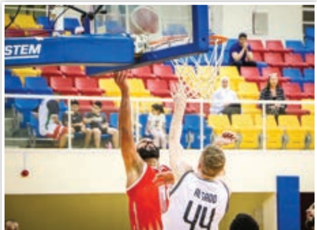
• من مباراة السد والشمال