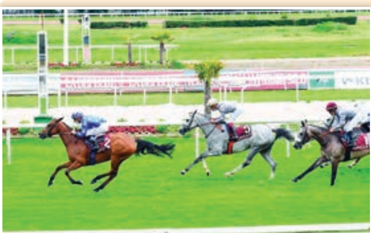
• من منافسات سباقية

أعلن أمس عن قائمة التداخل النهائية للخيل التي ستشارك في شوط جائزة (قطر ليلوفاج) من الفئة الثانية للخيل العربية الأصيلة الذي سيقام غدا الخميس على مضمار تولوز بفرنسا. وتضم القائمة النهائية أفضل الأفراس سيتنافسن فيما بينهم على مضمار تولوز لحصد اللقب، ومن بينها الفرس (موندنا) ملك الوسمية ريسنغ، والتي سبق لها الحصول على مركز الوصيفة في جائزة