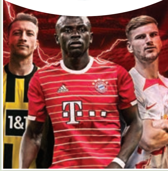
● البوندسليجا حصريا على beinsports