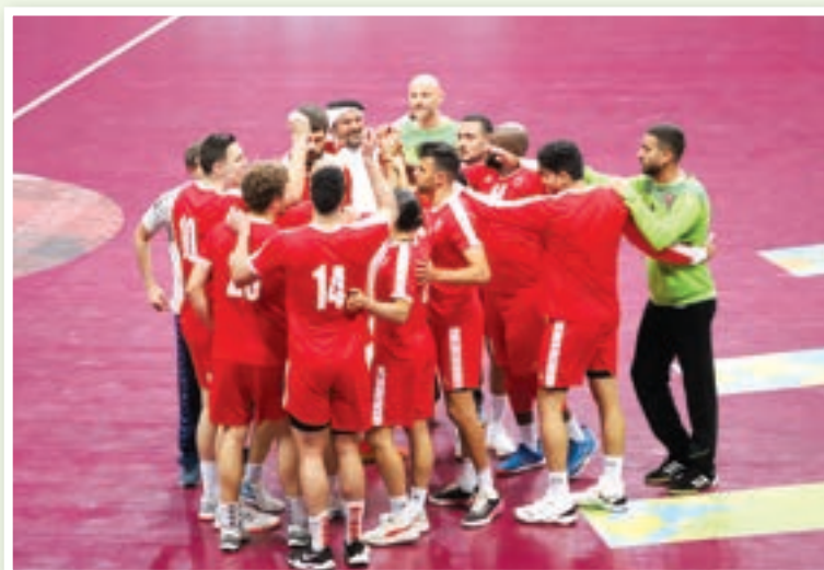
• فريق العربي لليد

نيودلبي- قنا- يلتقي العربي القطري مع النور السعودي، اليوم الأربعاء، في انطلاق البطولة الآسيوية الرابعة والعشرين لأندية أبطال الدوري للرجال لكرة اليد التي تستضيفها مدينة حيدر أباد بالهند حتى 30 يونيو الجاري، والمؤهلة لبطولة العالم للأندية أبطال القارات «سوبر جلوب 2022».