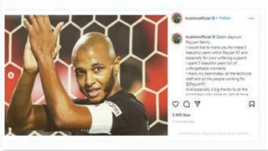
• تغريدة ياسين براهيمي

فاز الجزائري ياسين براهيمي بجائزة الحذاء الذهبي لأفضل لاعب في كأس العرب لكرة القدم، بعدما قاد بلاده لحصد اللقب عقب التفوق بهدفين نظيفين على تونس بعد وقت إضافي في النهائي في استاد البيت يوم السبت... وسجل براهيمي الهدف الثاني في الدقيقة الأخيرة من المباراة خلال نهاية الوقت بدل الضائع أمام أكثر من 60 ألف متفرج، بينما سجل قبله أمير سعيود الهدف الأول بتسديدة قوية في