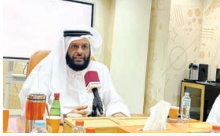
● الشيخ عبدالعزيز بن عبدالرحمن