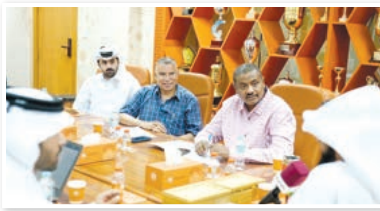
● من لقاء رئيس النادي ووسائل الإعلام

وأضاف الشيخ عبدالعزيز: لدينا اهتمام كبير بالأكاديمية وهي تجد منا تركيزاً ولدينا الآن 430 لاعباً، وارتفع عدد لاعبيننا في أسبانيا إلى 10 بعد أن كان 4 لاعبين. وتابع: نرفض بيع أي لاعب من المراحل السنية ويحمد الله حقننا (بطولتين) وهو أمر إيجابي ويجعلنا فخورين بلاعبينا الشباب. وأشار سعادة الشيخ إلى أنه مع استمرارية اللاعب وهناك برامج مهنية ومنصة تعليمية لكل المنتسبين للأكاديمية، وسيتم عمل تطوير وتحديث للأكاديمية. وأضاف رئيس النادي أنهم نفذوا تطبيق النادي