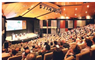
• جانب من الجلسات

خلال هذا الحدث على تطوير وتعزيز التعليم والتدريب التقني المهني في قطر، واستضافت الكية الكونفيرس كونس البحوث الرموق في مجال البحوث الإقليمية في فترة ما بعد الرحلة الثانية، وذلك لتقديم سلسلة من المحاضرات العامة خلال هذا الحدث، وهي المحاضرات التي تركز على التطوير المهني في قطاع التعليم والتدريب التقني والمهني وتنمية المهارات في القرن الحادي والعشرين. وهو الأمر الذي أعطى الفرصة لأعضاء هيئة التدريس في كلية شمال الأطلنطي في قطر والبالغ عددهم 500 شخصاً تقريباً، أعطاهم الفرصة للتطوير المهني وفقاً لموضوعات متنوعة مثل، إشراك الطلاب، والعرضيات المدعومة بالتكنولوجيا، والمختصات عبر الإنترنت، وتقنيات الفصول الدراسية التطبيقية والتجريبية.