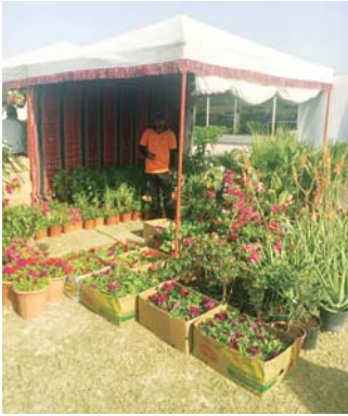
لقطة من مشتل الزهور

كما أن الفعالية تهدف لتشجيع المزارع على توسيع إنتاجها بما يساهم في تطويرها وزيادة عائداتها المادي.