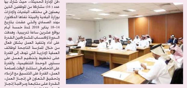
لقطة من الدورة التدريبية

اختتم مركز الدراسات البيئية والبلدية دورتين تدريبيتين خلال الفترة الماضية من تاريخ 14/8-2018م. وذلك انطلاقاً من سعي مركز الدراسات البيئية والبلدية لتقديم البرامج الهادفة التي تحقق رؤية وإرسالة وأهداف الوزارة، وضمن إطار حملة التدريب السنوية للمركز. وقد شارك في الدورة التدريبية الأولى التي كانت بعنوان الدورة التدريبية في الضبطية القضائية في مجال الرقابة