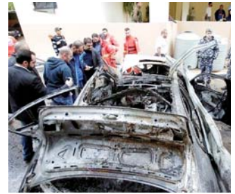
محاولة اغتيال حمدان في بيروت

بيروت- قنا- تسلم فرع المعلومات في قوى الأمن الداخلي اللبناني أمس، مواطناً لبنانياً مشتبهاً به في قضية محاولة اغتيال القيادي في حركة حماس محمد حمدان، من السلطات التركية. وذكرت وكالة الأنباء اللبنانية أن فرع المعلومات في قوى الأمن الداخلي اللبناني تسلم المشتبه به من الجانب التركي عبر مطار رفيق الحريري الدولي. وكان محمد حمدان القيادي الفلسطيني أصمياً إثر انفجار عبوة ناسفة في سيارته في مدينة صيدا جنوب لبنان في 14 يناير الحالي. يشار إلى أن محمد حمدان يقبض أيضاً بـ«ابوحمزة حمدان» وهو شقيق أسامة حمدان مسؤول العلاقات الدولية في حركة حماس.