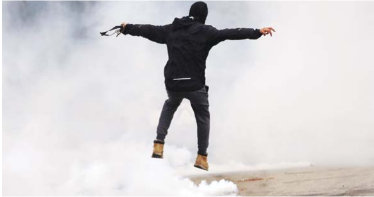
مواجهات وإضراب في الضفة الغربية

البيرودي وبارك الله دولة إسرائيل على مدى الدهر.. مايك بنس أول جولة له في الشرق الأوسط بزيارة إلى حائط اليكى (البراق) في القدس، في زيارة قاطعها الفلسطينيون بشكل تام بعد فرار واشنطن الشهر الماضي الاعتراف بمدينة القدس عاصمة لإسرائيل. ونفذ الفلسطينيون أمس إضراباً عاماً في الضفة الغربية المحتلة للاحتجاج على زيارة بنس والتأييد بالاحتياز التام لإسرائيل الذي تنتهجه إدارة ترامب، واندلعت مواجهات مع القوات الإسرائيلية بالقرب من الحواجز العسكرية والمستوطنات. وعند أحد مداخل مدينة رام الله، مقر السلطة الفلسطينية، قام مئات من الفلسطينيين بإلقاء الحجارة على الجنود الإسرائيليين الذين ردوا باستخدام الرصاص المطاطي والغاز المسيل للدموع وقنابل الصوت لتفريق المتظاهرين. وزار بنس أيضاً نصب «ياد فاشيم» لضحايا المحرقة إبّان الحرب العالمية الثانية. وفي يومه الأخير، أكد بنس المسيحي الإنجيالي المشدد خلال لقائه الرئيس الإسرائيلي رؤوفين ريفلين أنه يعتقد أن الاعتراف بمدينة القدس التمدد في مفاوضات ذات معنى لتحقيق سلام دائم وإنهاء الصراع المستمر منذ عقود. وود ريفلين باللغة العربية المحتلة، وراشدني وقام بنس بعد ظهر الثلاثاء بزيارة حائط اليكى (البراق)، في القدس الشرقية المحتلة، وراشدني لقضية سدود تقليدية على رأسه. وقام بوضع قطعة من الورق داخل أحد فتحات الحائط، أمثالاً للتقليد المعتاد في الموقع. وكتب بنس على دفتر الزوار: «انه لشرف عظيم أن أصلي هنا في هذا الموقع المقدس، بارك الله الشعب