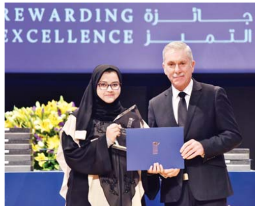
● جانب من التكريم

كرمت كلية شمال الأطلنطي في قطر طلابها المتفوقين لإنجازاتهم الأكاديمية للعام الدراسي 2016-2017 وذلك في حفل توزيع الجوائز للمتفوقين السنوي والذي أقيم يوم الأربعاء الماضي 15 نوفمبر في حرم كلية شمال الأطلنطي في قطر بحضور الإدارة التنفيذية للكلية وشخصيات مجتمعية بارزة حيث يعتبر هذا الحفل واحداً من أهم الاحتفالات في كلية شمال الأطلنطي في قطر. وأقيم حفل توزيع الجوائز للمتفوقين