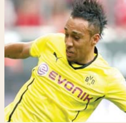
• إيميريك أوباميانج