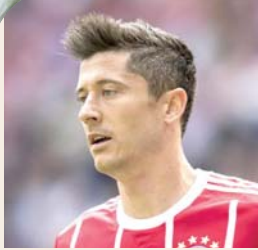
• روبرت ليفاندوفسكي