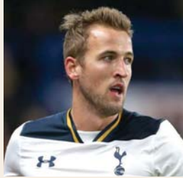
• هاري كين