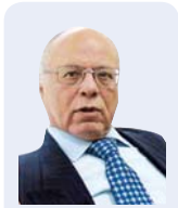
عاطف الغمري كاتب مصري

يميل الدارسون للظاهرة الإرهابية في العالم، ليلبث فيما أسموه سيكولوجية العقل الإرهابي، والذي يصفه بعضهم بتعبير The Jihadi State of Mind خاصة بعد أن صار الإرهاب أداة من أدوات حزب الجبل الربيعي. وبعض هذه الدراسات راحت تستلهم سيكولوجية الإرهابي، وفهم عقليته، والدوافع التي نقلته من كونه فردا عاديا في مجتمعه، إلى الانتماء لجماعة ترفض المجتمع وتجاهه، وتبني وهم، وتعلن الحرب عليه، فضلا عن تصنيف العالم، على أنه منقسم إلى «نحن»، وهم». حسب خط العنقاء الذي رسموه ليفصل بينهم وبين غيرهم أيا كانوا.