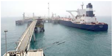
إيران ترفع طاقتها التصديرية للهند

في 16.7 في المئة مقارنة مع مستواها في يناير وازدياداً تبلغ نحو ثلاثة أمثال تقريبا مقارنة مع مستواها في فبراير 2016. وتعددت منظمة البلدان المصدرة للبترول (أوبك) بتقليص الإنتاج بنحو 1.2 مليون برميل يوميا اعتبارا من الأول من يناير وهو أول خفض في ثماني سنوات وذلك على تخمة العروض، لكن جرى إعفاء إيران وليبيا وبنجربا من الاتفاق. واستوردت الهند في الأشهر الأحد عشر الأولى من هذا السنة المالية في 542 ألفا و400 برميل يوميا من إيران مقارنة مع نحو 225 ألفا و522 برميلا يوميا في نفس الفترة قبل عام، وارتفع متوسط كميات النفط التي توردتها إيران خلال تلك الفترة لأعلى مستوى على الإطلاق.