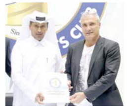
المدرّب مع رئيس نادي الخور